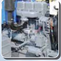
फ्युअल एफिशिन्ट इंजन

ग्राहक का पहला भरोसा है, स्वराज ट्रैक्टर. क्योंकि इसके दमदार इंजन और 1800 रेटेड RPM से हर काम बने आसान, और ट्रैक्टर बने लंबी रेस का घोड़ा. इतना ही नहीं, इसकी आकर्षक बनावट उत्साह बढ़ाती है. ट्रैक्टर को तन के चलाने के लिए सही मायने में स्वराज अनगिनत खूबियों से सजा एक सम्पूर्ण ट्रैक्टर है.