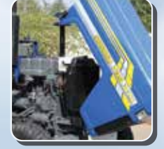
सिंगल पीस हूड