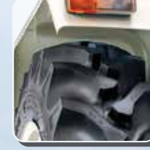
13.6 x 28 पिछला टायर