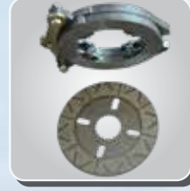
ऑयल इमर्ज्ड ब्रेक्स